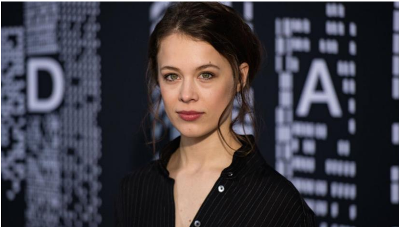
Paula Beer, deutsche Schauspielerin

Als die Schauspielerin spontan nach Paris zog, entdeckte sie die Vorteile des Alleinseins. Sie kannte dort niemanden. Paula Beer erzählt: